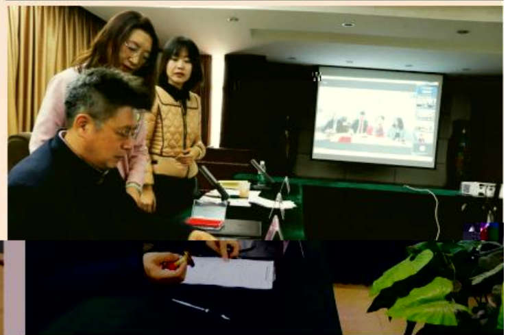
为贯彻落实《国务院办公厅关于印发 积极作用,为提升我院国际化办学水平