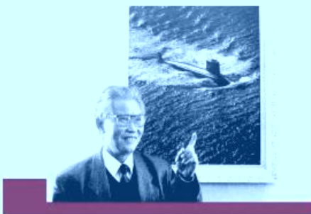
3月22日，我国核潜艇首任总设计师彭士禄，永远离开了他毕爱的事业，他和夫人的骨灰，在渤海湾葫芦岛海域被撒入大海。他终于能够深潜海底，永远守望着，祖国这片蓝色海洋！