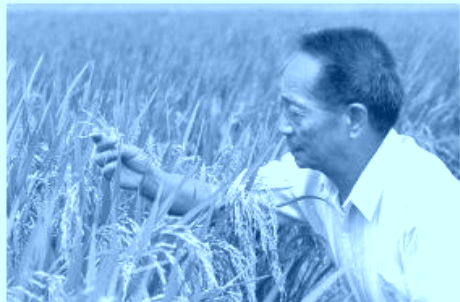
5月22日，对很多人来说，都是个万分悲痛的日子，就在这一天，“杂交水稻之父”袁隆平，永远离开了我们。为了实现，“让所有中国人不再饿肚子”，这个简单而又艰难的心愿，他咀嚼过失败的苦涩，也品尝过质疑的苦楚，锋棱磨骨，回首能让天地叹服，风入步轻，转身已是稻花香！