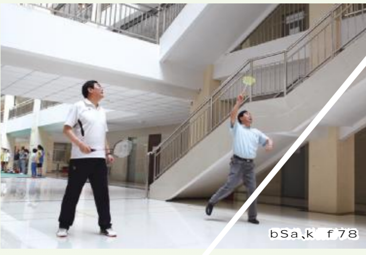
bSa,k f 78

RS \ , [- FGD , 促 ! E , 6 24 ) , 相 C 就 c 5 , + 2015 6 f 。 n 。 Q 4 Qz LM W : 7 、 G, 、 、 7 、 6 10 。 S) v h