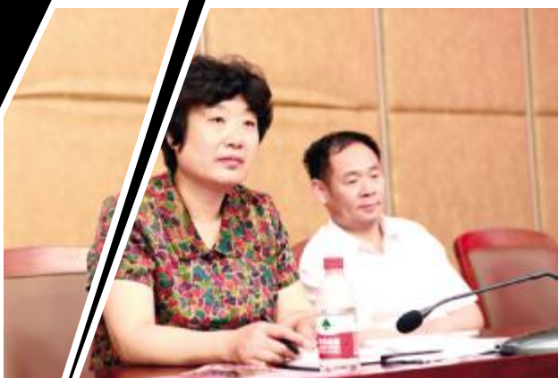
6月4日上午，安徽省亳州市政协副主席龚艳玲一行来我院就职业教育发展进行考察交流。市政协教科文卫委主任徐加强、市教育局副局长胡同发等