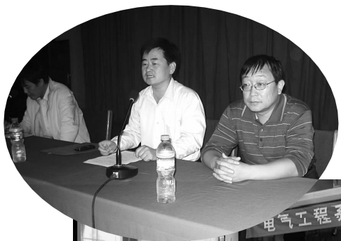
电气工程系迎新文艺晚会